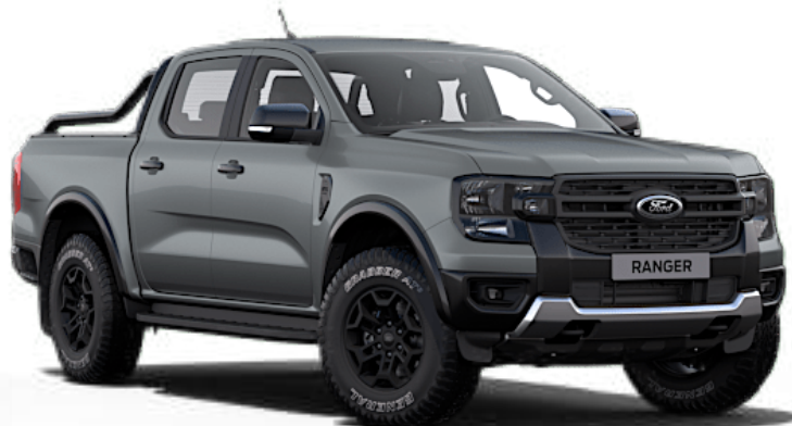
Gris Commandeur †† Peinture spéciale non métallisée