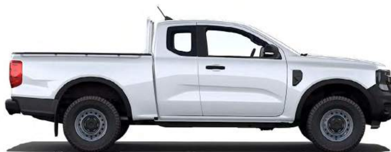
RANGER SUPER CAB