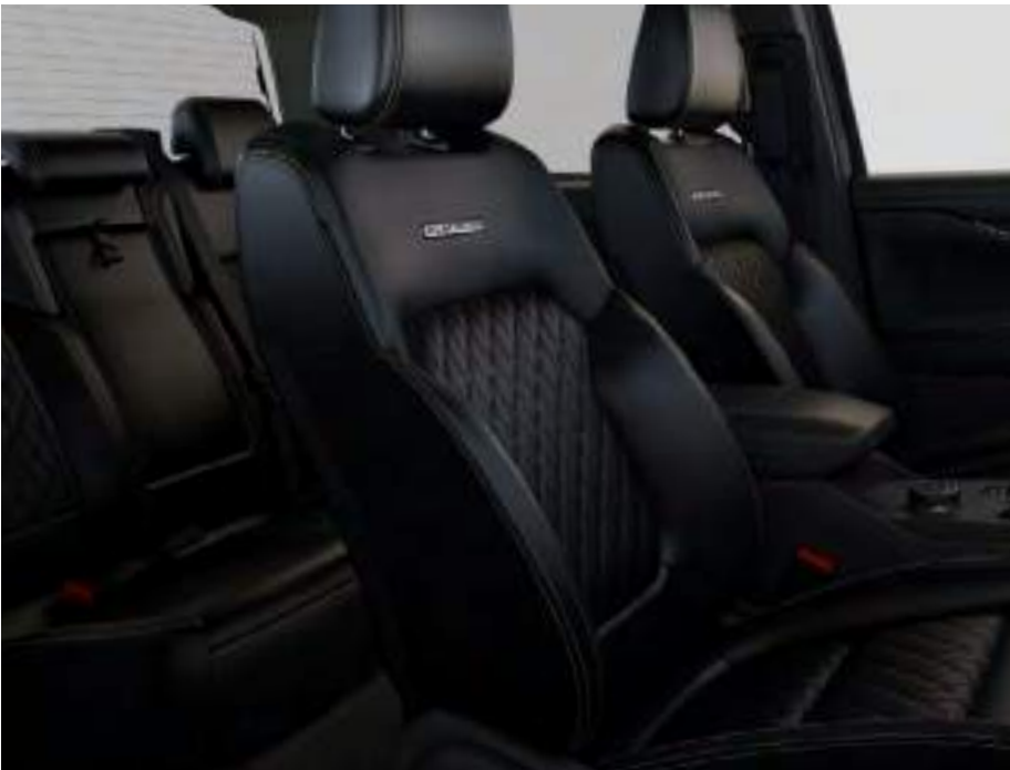
Sellerie cuir Assise de siège : Cuir Premium Platinum gaufré Rembourrage latéral : Cuir Premium Platinum De série sur Platinum