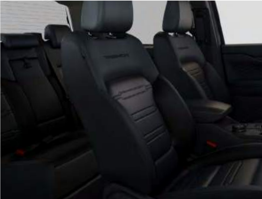
Sellerie Vinyle Assise de siège : Vinyle Ebony Rembourrage latéral : Vinyle Ebony De série sur Tremor