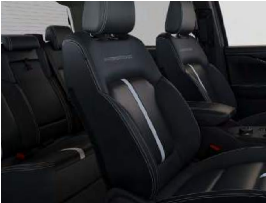
Sellerie cuir Assise de siège : Cuir Premium Ebony Rembourrage latéral : Cuir mat Ebony De série sur Stormtrak