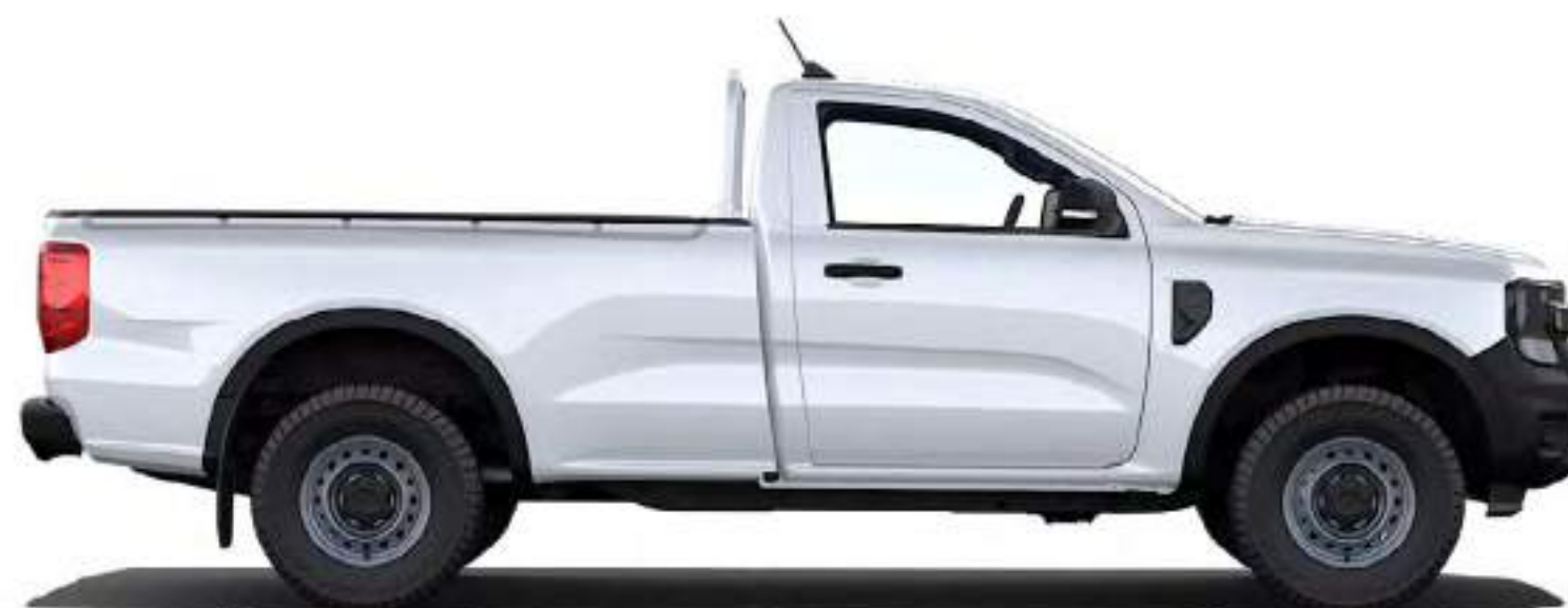
RANGER SIMPLE CABINE

Avec un large choix de carrosseries, d'équipements et d'options de personnalisation, il existe forcément un Ford Ranger qui vous convient.