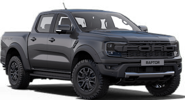
Gris Météore † Peinture métallisée