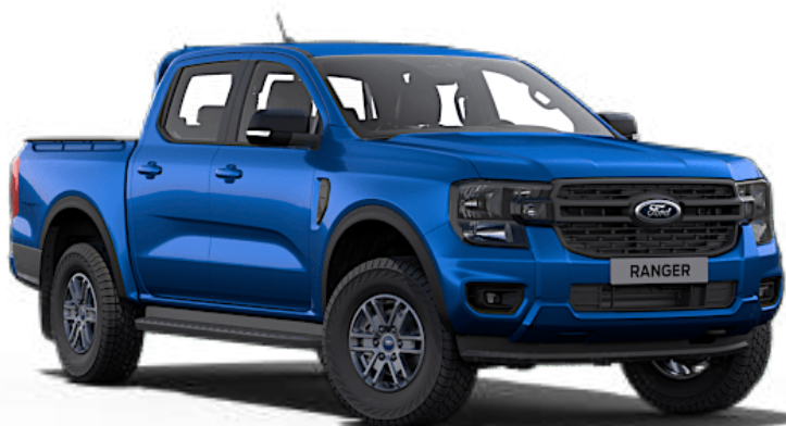
Bleu Lightning ††† Peinture métallisée

Remarque Les images utilisées ont pour objet d'illustrer les teintes de carrosserie et peuvent ne pas être représentatives du véhicule décrit. Les peintures et garnissages reproduits dans cette brochure peuvent être différents des couleurs réelles du fait des limites des processus d'impression utilisés. Certaines peintures métallisées et/ou spéciales sont disponibles en option payante.