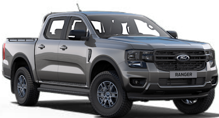
Gris Carbone †† Peinture métallisée