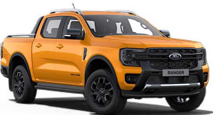
Cyber Orange † Peinture spéciale métallisée