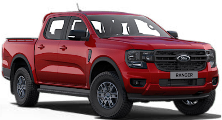
Rouge Lucid ††† Peinture métallisée