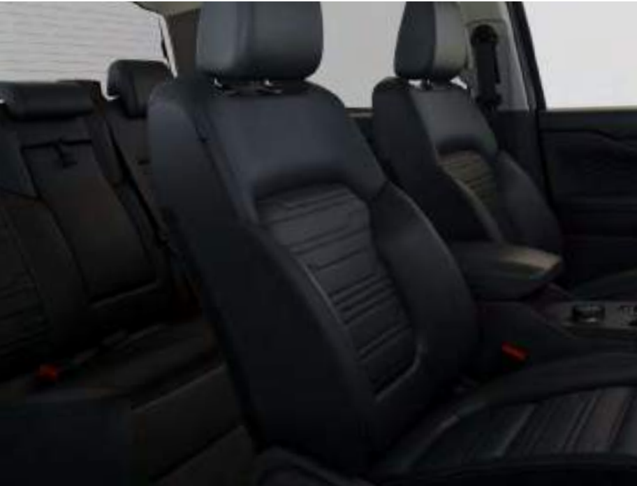
Sellerie cuir Assise de siège : Cuir gaufré Ebony Rembourrage latéral : Cuir Ebony De série sur Limited