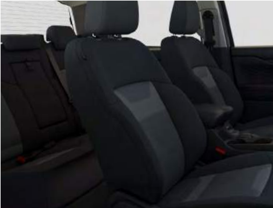
Sellerie tissu anthracite Assise de siège : Tissu noir Rembourrage latéral : Tissu noir De série sur XL