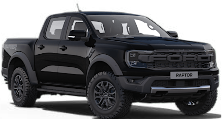
Noir Shadow † Peinture métallisée