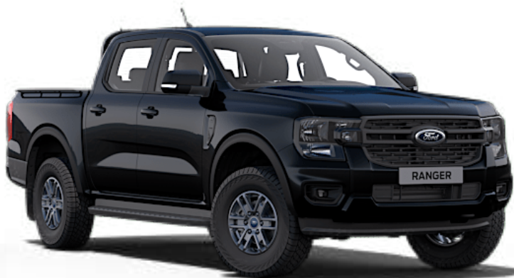
Noir Agate †† Peinture métallisée