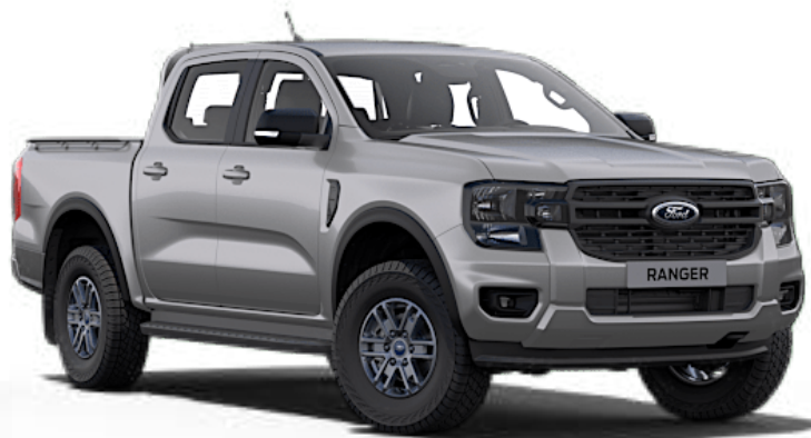
Gris Iconic †† Peinture métallisée