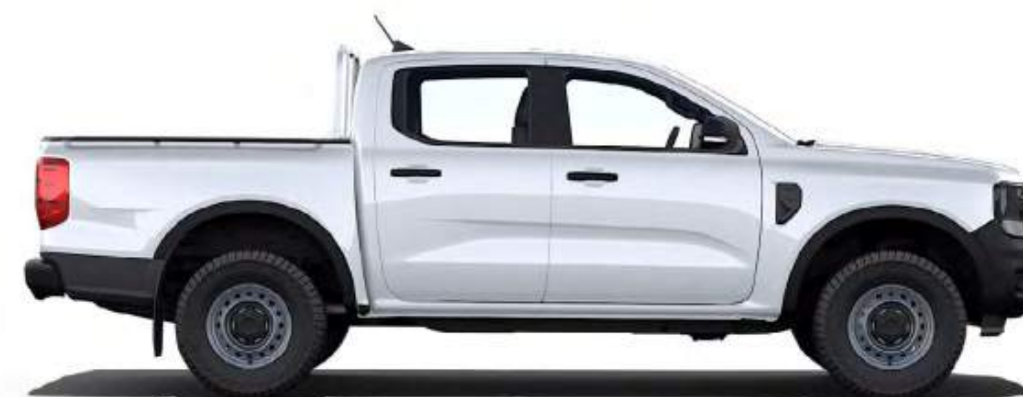
RANGER DOUBLE CABINE