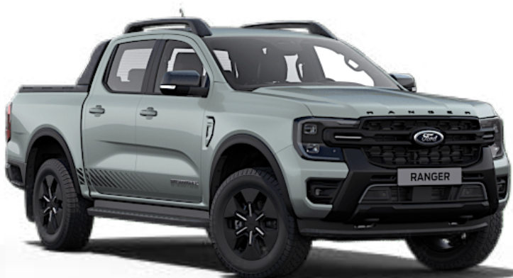
Gris Zen ° Peinture spéciale non métallisée