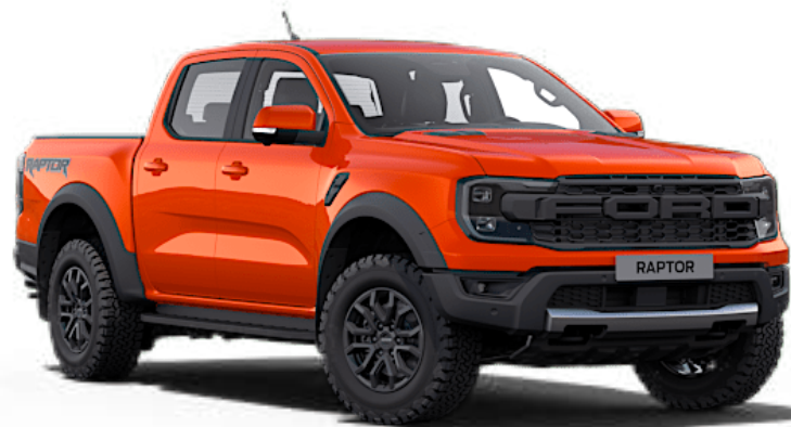
Orange Raptor † Peinture spéciale non métallisée

Grâce à un processus de peinture spécial en plusieurs étapes, votre Ford Ranger conservera sa belle apparence pendant de nombreuses années.