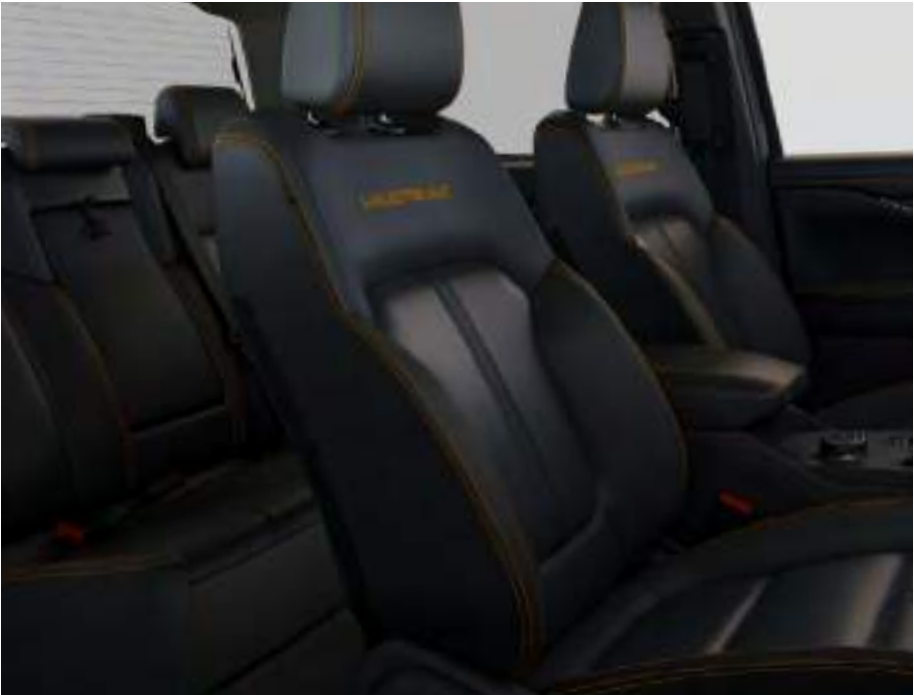
Sellerie cuir Assise de siège : Cuir Premium Ebony Rembourrage latéral : Cuir mat Ebony De série sur Wildtrak