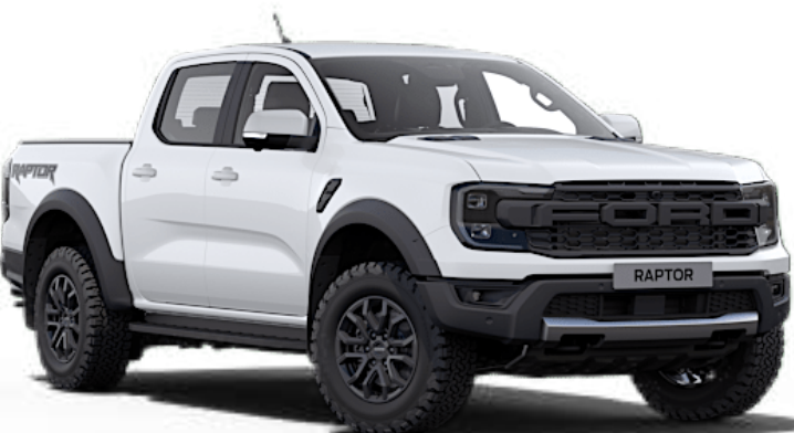
Blanc Arctique † Peinture non métallisée