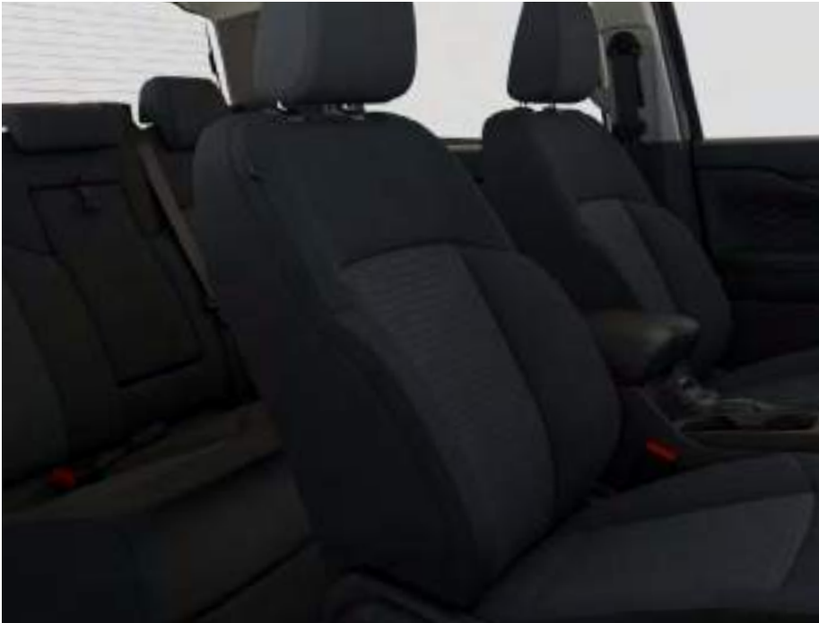
Sellerie tissu noir premium Assise de siège : Tissu gaufré noir Rembourrage latéral : Tissu noir De série sur XLT