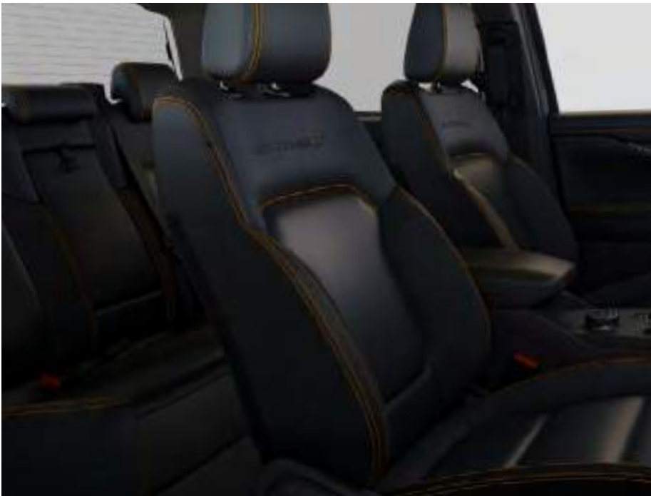
Sellerie cuir Assise de siège : Cuir Premium Ebony Rembourrage latéral : Cuir mat Ebony De série sur Wildtrak X