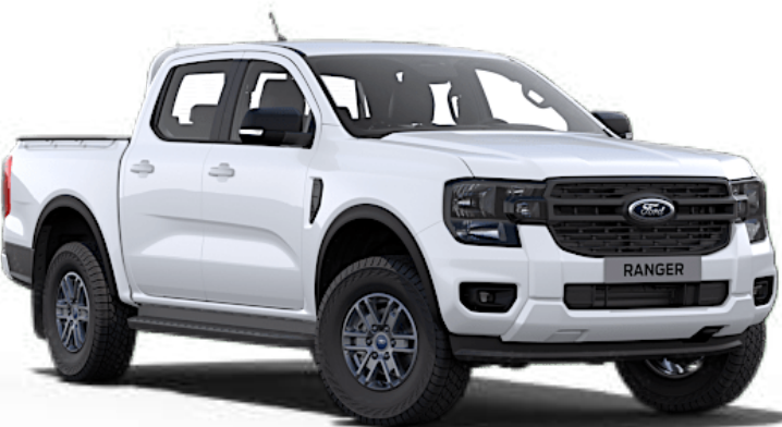
Blanc Glacier †† Peinture non métallisée