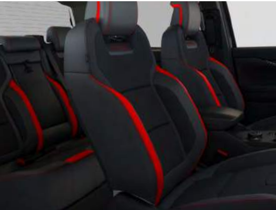
Sellerie cuir et Alcantara spécifique Raptor Assise de siège : Cuir Premium Ebony Rembourrage latéral : Cuir mat Ebony De série sur Raptor

Remarque : Sensico® est une marque de Ford Europe de sellerie synthétique haut de gamme développée pour les habitacles automobiles. Cette sellerie à base végétale est esthétique et durable. Elle est facile à nettoyer, anti-taches et anti-odeurs. Grâce à sa haute qualité, Sensico® procure un confort incomparable même pendant les longs trajets.