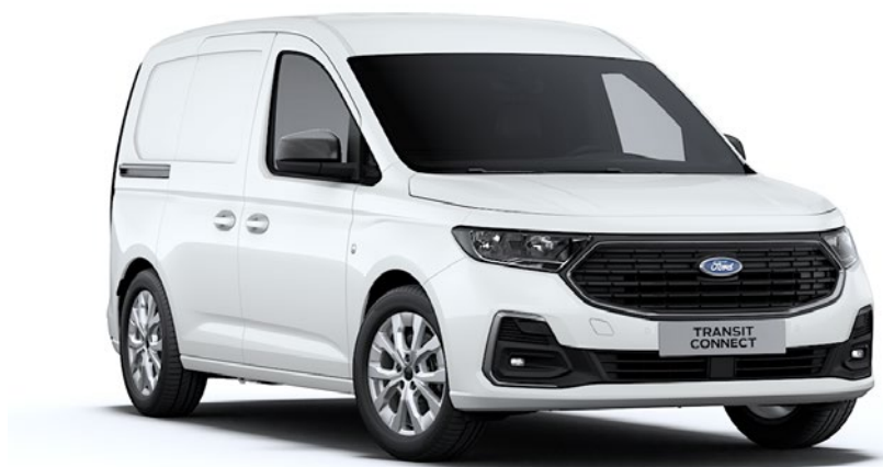
Blanc Glacier Peinture non métallisée