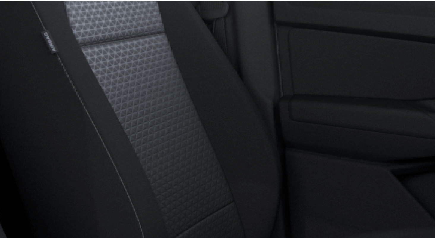
Bubble Ford Kylo Emboss en Soul/Clip in Soul (avec surpiqûres grises) De série sur Limited