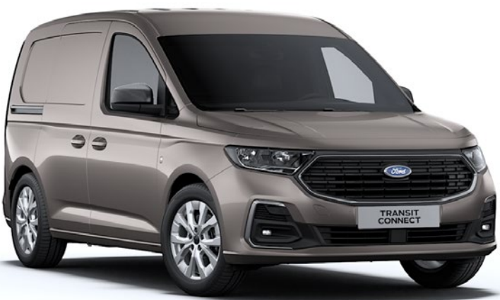
Beige Sable Peinture métallisée*