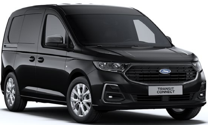
Noir Intense Peinture métallisée*