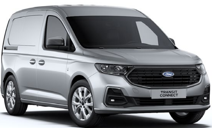
Gris Argent Peinture métallisée*