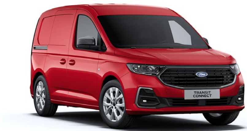
Rouge Lave Peinture non métallisée