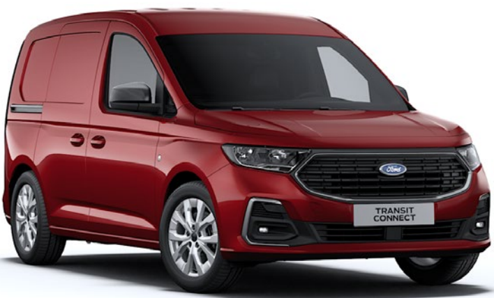
Rouge Erable Peinture métallisée*