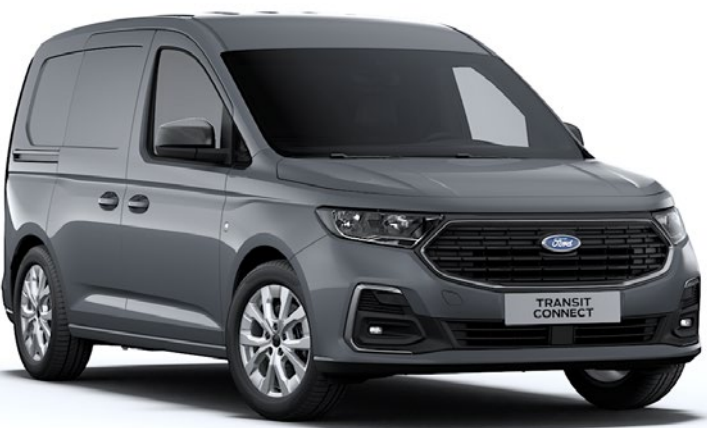
Gris Acier Peinture non métallisée