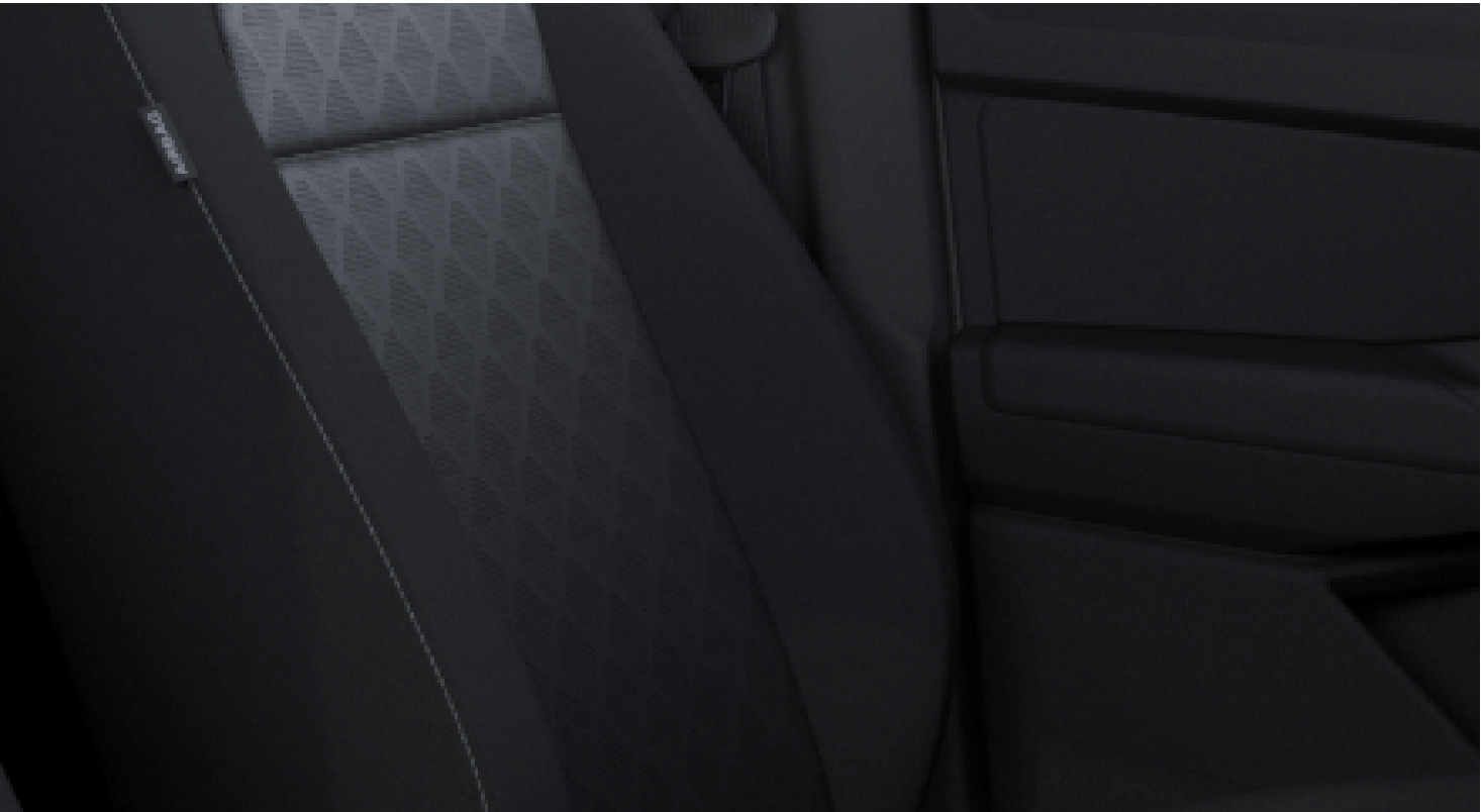
Ford Diamond Perforated Sensico® in Soul/Bison mini grain Sensico® in Soul En option sur Limited