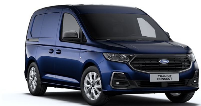
Bleu Nuit Peinture métallisée*