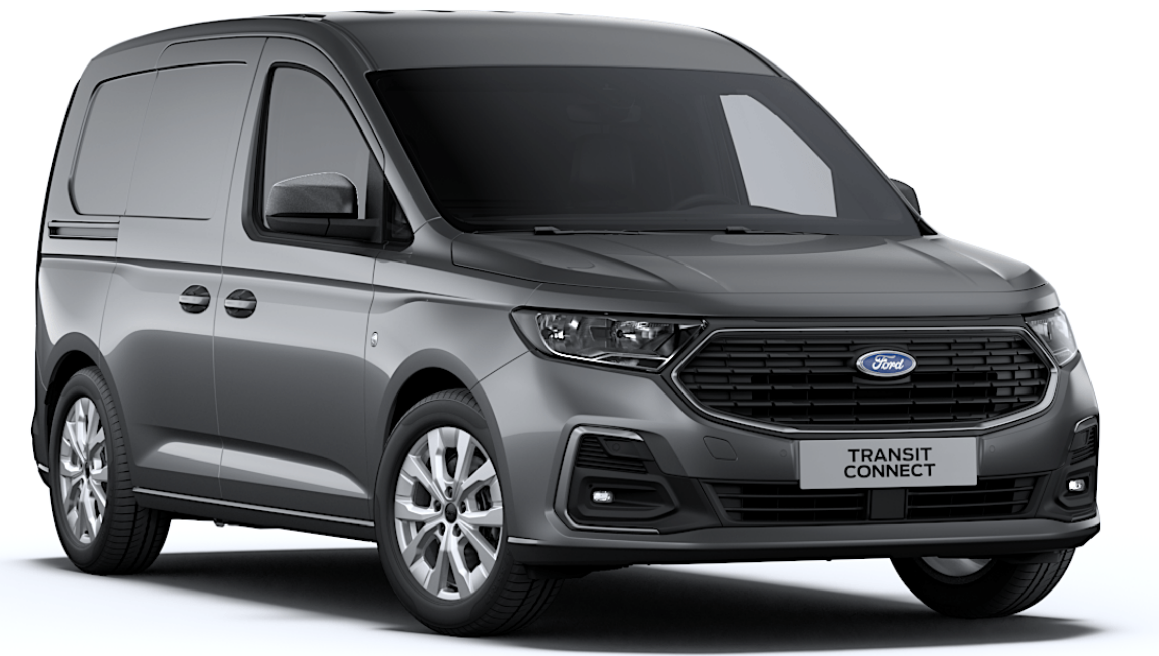
Gris Graphite Peinture métallisée*

Un processus de peinture spécial en plusieurs étapes donne au Ford Transit Connect la durabilité de son extérieur. Il garantit que votre nouveau véhicule conservera sa belle apparence pendant de nombreuses années.