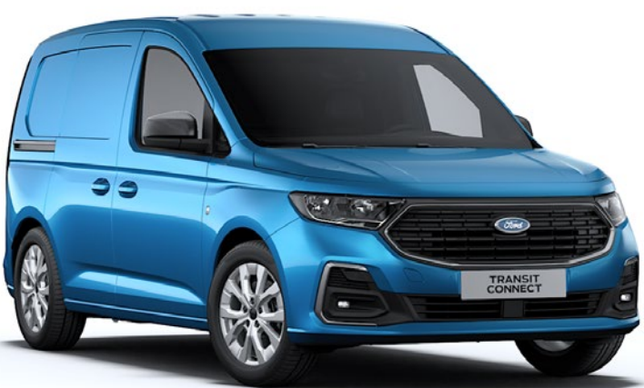
Bleu Horizon Peinture métallisée*

Remarque : Les photos de véhicules illustrent les teintes de carrosserie et peuvent ne pas correspondre aux spécifications actuelles des véhicules ou à leur disponibilité sur certains marchés. Les peintures et garnissages reproduits dans cette brochure peuvent être différents des peintures réelles du fait des limites inhérentes aux processus d'impression utilisés.