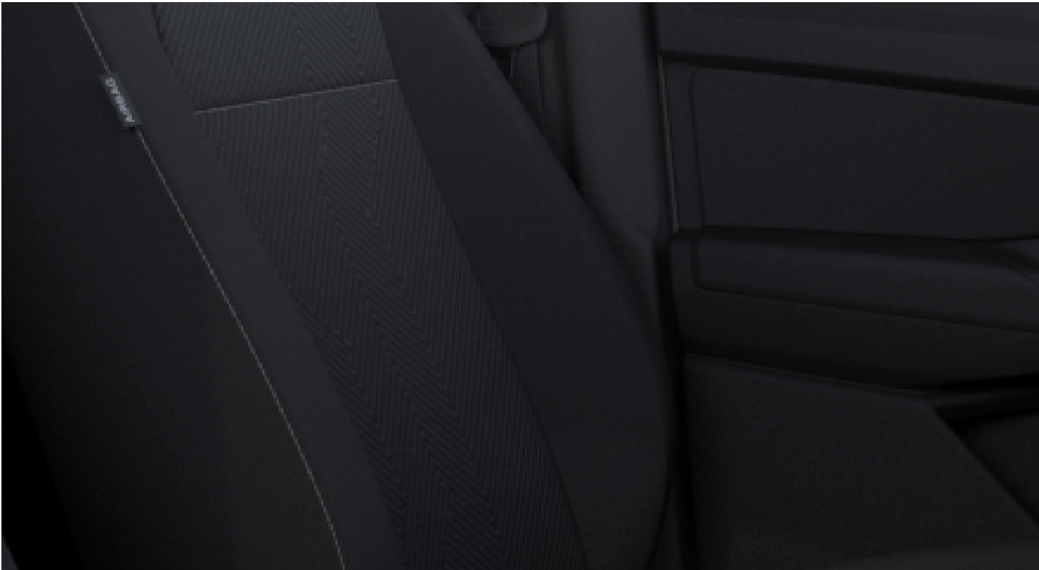
Exnor in Soul/Clip in Soul De série sur Trend